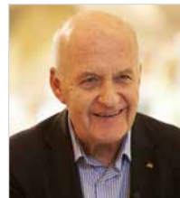
Prof. Götz W. Werner Gründer und Aufsichtsrats- mitglied des Unternehmens dm-drogerie markt, dessen Geschäftsführer er 35 Jahre lang war