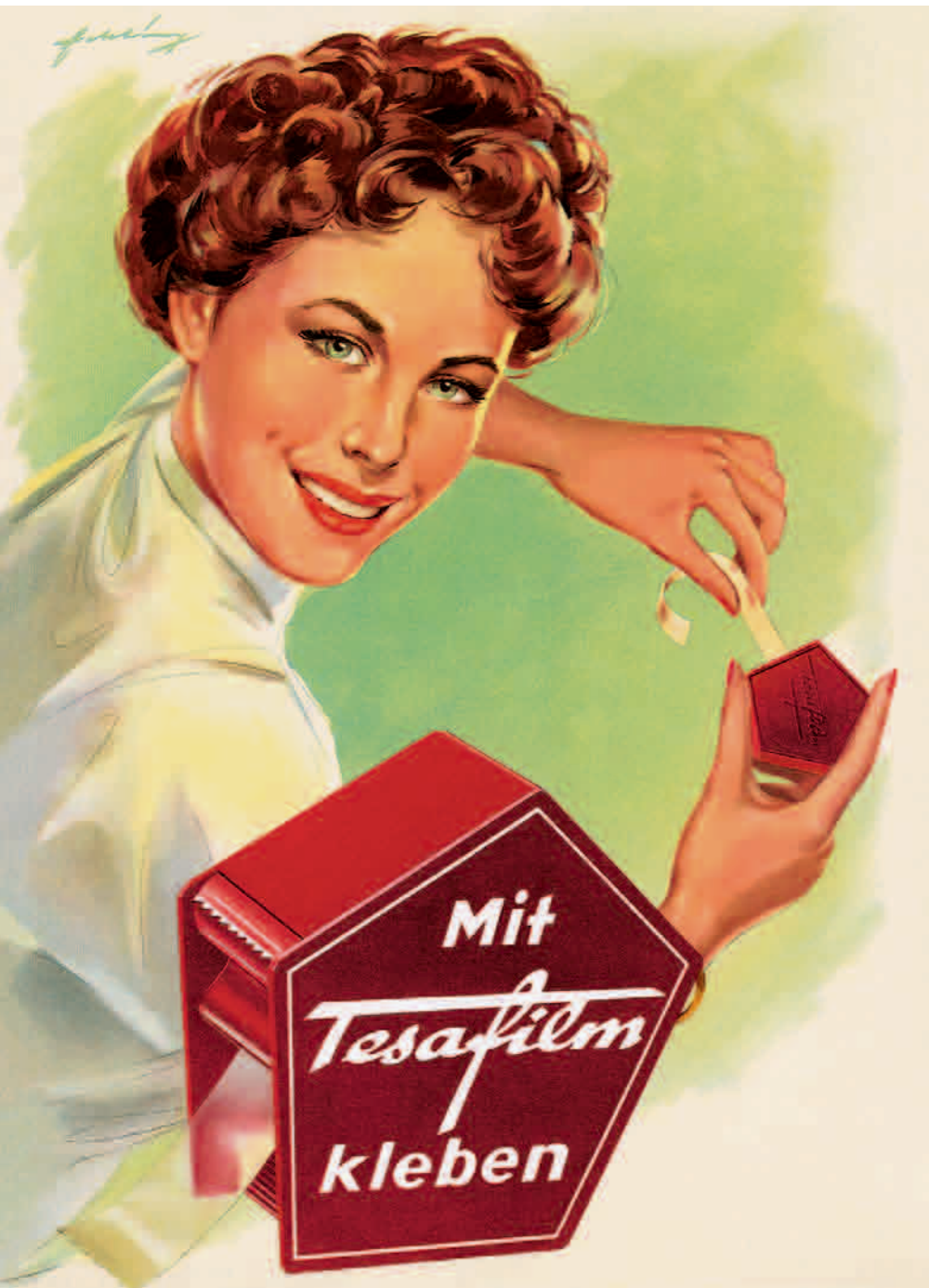
Der transparente Klebefilm kam 1936 auf den Markt und ist Namensgeber der Dachmarke.

Verpackungsdialog im Verpackungsmuseum | „Ehrlich währt am längsten“ heißt es und tatsächlich gilt das auch für Marken. Es ist auffallend, dass Traditionsmarken oftmals mit einem eher konservativen Werkanon verbunden sind. Wie Unternehmen verhindern, dass aus dem Bemühen zu bewahren eine festgefahrene Positionierung entsteht, diskutierten die Teilnehmer beim 14. Deutschen Verpackungsdialog.